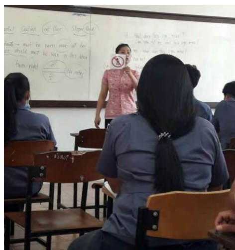
ภาพประกอบที่ 1 กิจกรรมการเรียนรู้ในการทดลอง